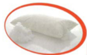
100% FIBRA ANALLERGICA