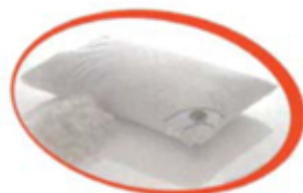
100% PIUMINO D' OCA