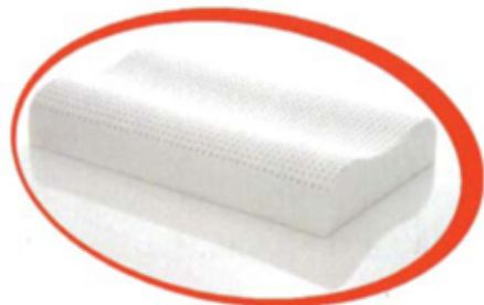
100% LATTICE ORTOPEDICO