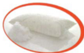
100% PURO COTONE