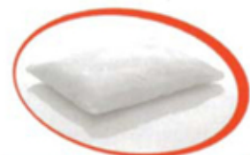
100% PURA LANA