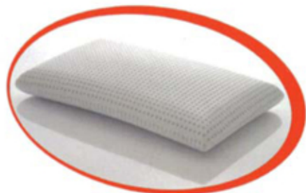
100% LATTICE SAPONETTA